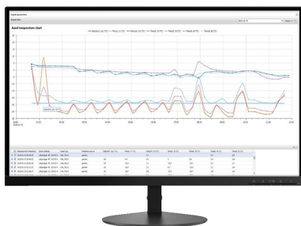
Övervaka temperaturen hos ditt gods i realtid.

Du installerar den enkelt i din lastbil eller trailer och den skickar sina positioner och andra viktiga data till Co-Driver Weboffice, där du har tillgång till de data som samlas in ute på fältet. Asset Pro har ett uppladdningsbart batteri, vilket gör att data kan skickas även när trailern är fränkopplad.